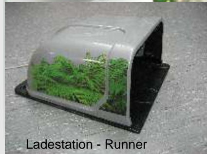
Ladestation - Runner

Mähen auch Sie mit einem Zukunftsorientierten Mähsystem. Keine Grasersorgung, ständig gedüngter Rasen durch Rückführung des Schnittgutes.